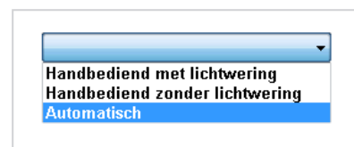
Figuur 7 - bediening zonwering

Als het gebouw is uitgevoerd met zonwering dan is niet alleen het type zonwering (screens/ uitvalschermer, ...) maar ook de wijze waarop de zonwering wordt bediend is van belang. In het Scholen°Concept is het mogelijk om met behulp van een weerstation de zonwering automatisch te regelen.